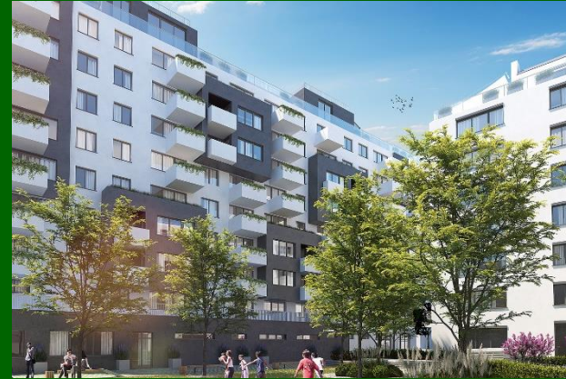
Die neue Jägerstraße 58

192 Eigentumswohnungen sowie Nahversorger und Kindergarten